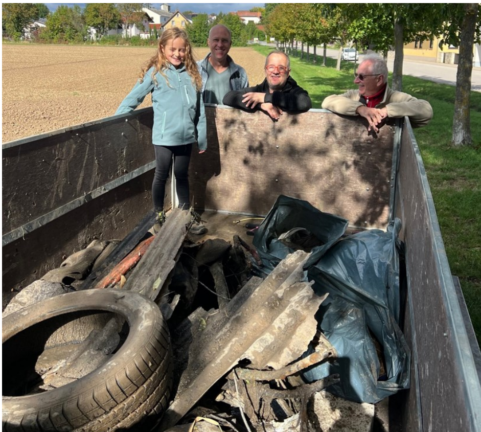
Gute „Ausbeute“ und gute Laune bei der Müllsammelaktion

Die Arbeit bei der Müllsammelaktion am 28. September war in zwei Stunden erledigt. Im und um den Ort gab es erfreulich wenig Müll zum Einsammeln. Vielleicht zeigt sich auch hier: je sauberer ein Ort ist, desto weniger Dreck wird gemacht. Ganz anders dagegen in der Selz. Im Abschnitt zwischen Bahnhofstraße und Atzelmühle haben wir zwei Fahrräder, eine Warnbake, einen Autoreifen, diverse Kleidungsstücke und Unmengen an Plastikfolien aus dem Bach geholt. Wir konnten den Dreck-Weg-„Tag“ schon vor Mittag bei einem geselligen Mittagessen an der Pilgerrast ausklingen lassen.