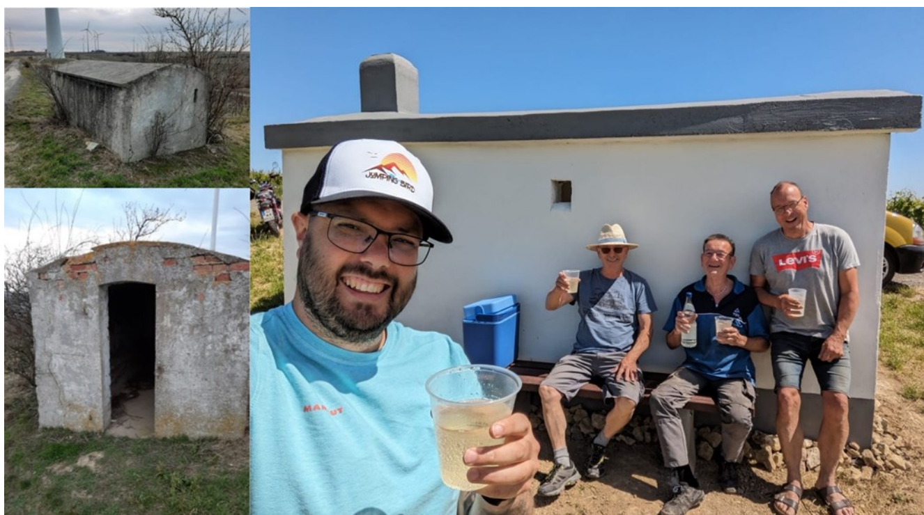
Das Wingertsheisje auf dem Hornberg vorher (links) und beim Probesitzen auf der neuen Bank, dem krönenden Abschluss der Sanierung (rechts)

Als Ortsgemeinde können wir nicht nur auf die schönen Wingertsheisjer stolz sein, sondern vor allem über so viel Engagement und Zusammenhalt im Ort.