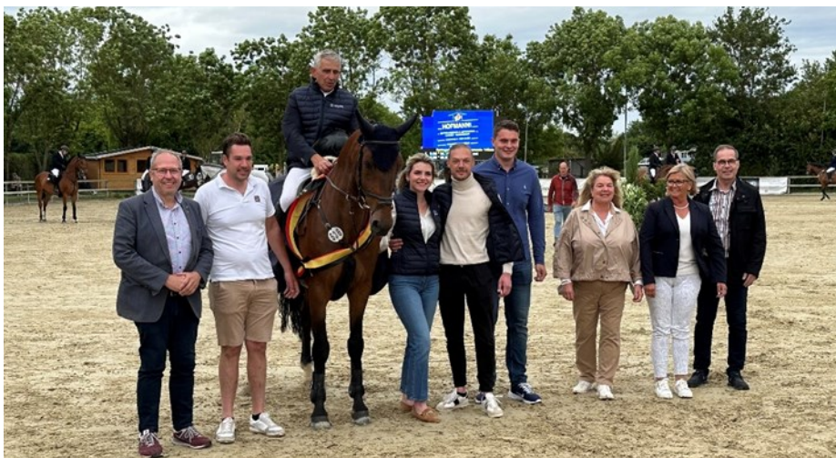
Siegerehrung „Großer Preis von Framersheim“