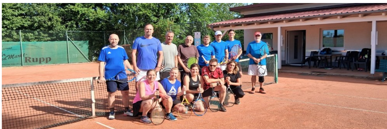
Text: Anke Follak

In der Mittagszeit wurde der Grill angeheizt und das Mitgebrachte zu einem leckeren Büffet zusammengestellt. Schon lange haben wir nicht mehr so viel Zeit im Verein mit so Vielen gemeinsam verbracht und dabei festgestellt, wir können es noch: Spielen und Feiern. Erst gegen Abend sind die letzten Spieler vom Platz gegangen, immer wieder fanden sich neue Gruppierungen zu einem „letzten Spiel“. Ein wunderschöner Saisonabschluss geht einher mit der Vorfreude auf die neue Saison im Jahr 2026!